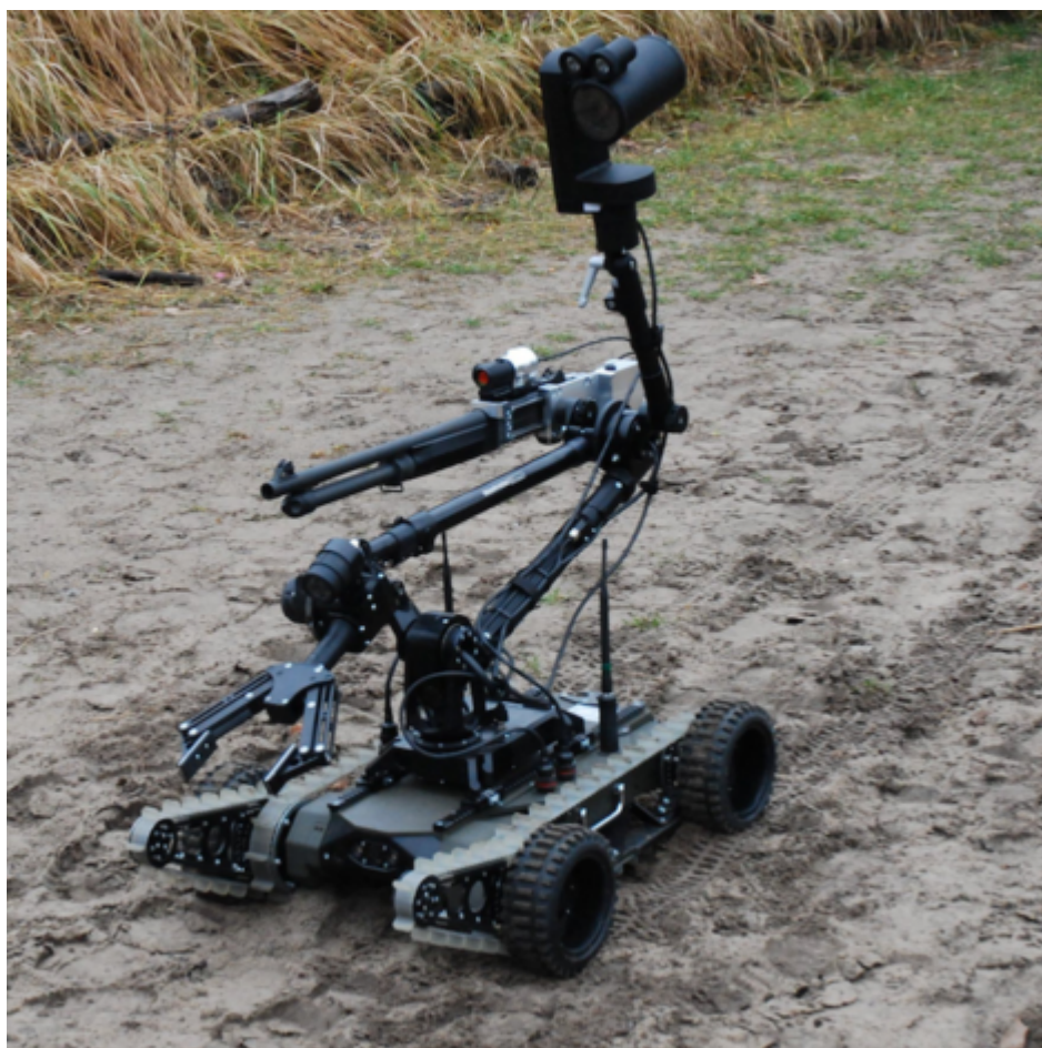
Robot PIAP GRYF.

Roboty PIAP GRYF wesprą pracę policyjnych pirotechników przy rozpoznaniu i neutralizacji ładunków niebezpiecznych. Dostarczone wraz z robotami wyposażenie dodatkowe umożliwi współpracę z urządzeniami rentgenowskimi, wyrzutnikami pirotechnicznymi i strzelbami. Roboty wyposażone są w zestaw akcesoriów automatycznie pobieranych z banku narzędzi, który zwiększa ich możliwości użytkowe. Na zestaw składają się: wybijak do szyb, nożyce do cięcia przewodów oraz nóż do przebijania opon.